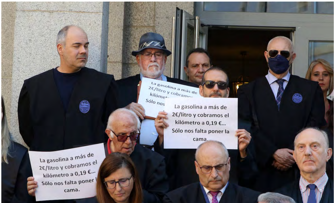
Protesta de los abogados del turno de oficio en Segovia. /

En la provincia hay cerca de 120 abogados que cobran tres veces menos que sus compañeros de otras comunidades