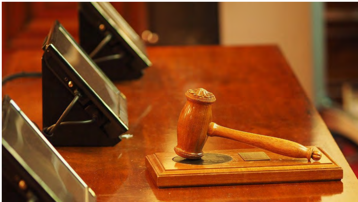
Maza de un juez.

El 81% de las solicitudes se atendieron y el turno de oficio resolvió 6.975 asuntos por importe de 1,6 millones de euros