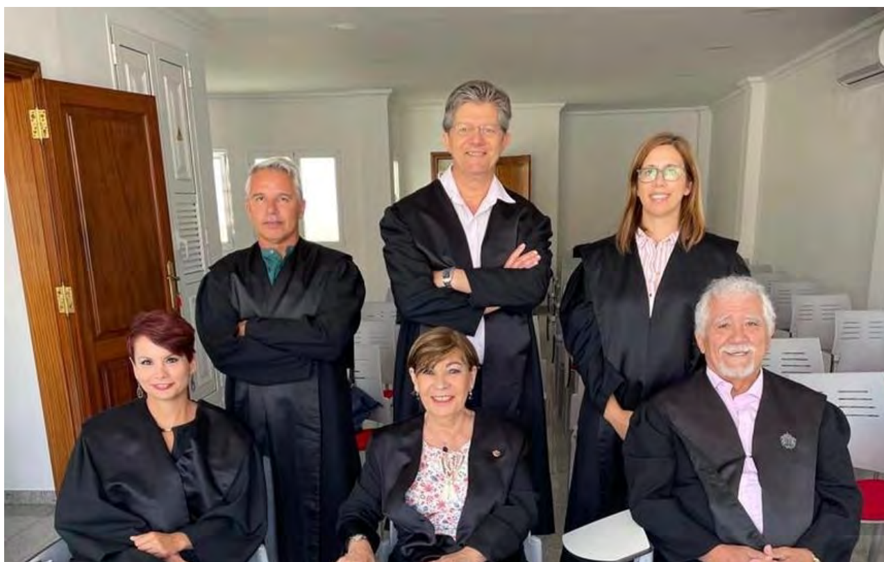
Imagen de alguno de los abogados del turno de oficio con el decano del Colegio de Lanzarote.