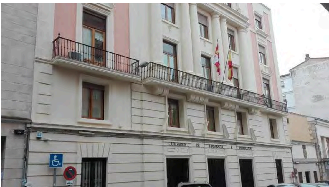
Sede de los Juzgados de Zamora

Los abogados de oficio celebraron ayer, con distintas actividades en algunos puntos de la comunidad autónoma, el día de la justicia gratuita. Una justicia gratuita que ha aumentado en esta provincia prácticamente un 30 por ciento en el pasado año.